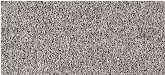
94 4m + 5m