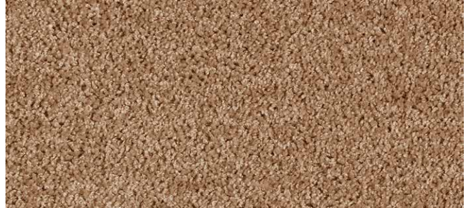
33 3m + 4m + 5m