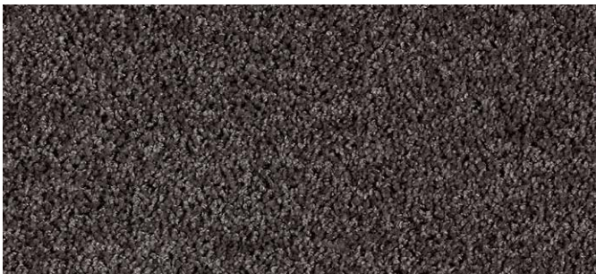
97 3m + 4m + 5m