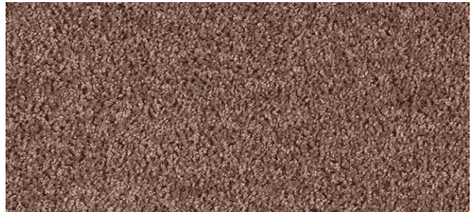
41 3m + 4m