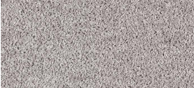
90 3m + 4m