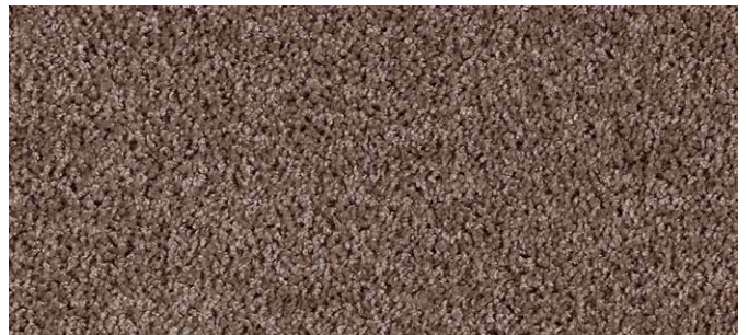
49 4m + 5m